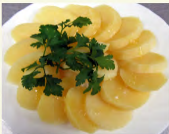
Картофель отварной с зеленью (250/5) 40 руб