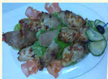
Рулетики "Из свинины с начинкой" (580/80) на 6 человек 1150 руб