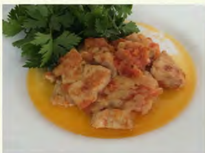
Куриная грудка с помидорами(160/10) 200 руб