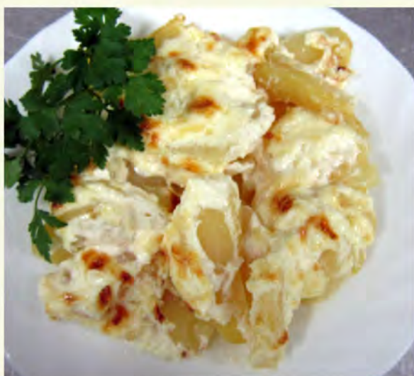
Картофель запечённый по-домашнему (250/3) 70 руб