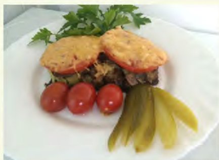
Язык "Услада"(235/30/30/5) 450 руб