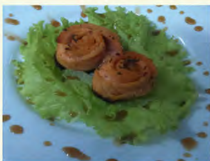
Закуска из красной рыбы (100/10) 350 руб