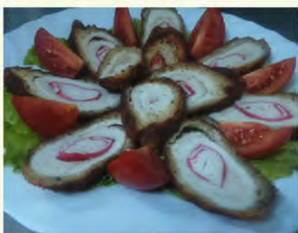
Курица с мясом крабов (200/10/80) 250 руб