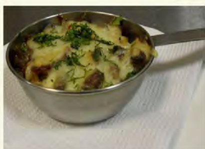
Жульен Праздничный(110/3) 180 руб