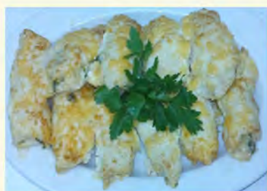
Куручка по-боярски (600) на 6 человек 800 руб