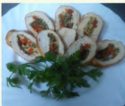
Закуска из курицы (1/150) 200 руб