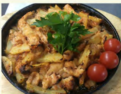
Куриная грудка в сметане и томате (200/30/5) 200 руб