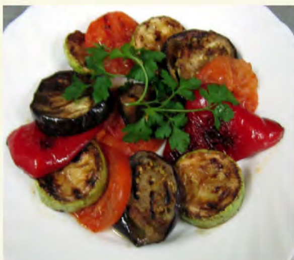
Овощной гарнир (1/150) 150 руб