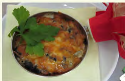
Жульен Наслаждение(110/3) 180 руб